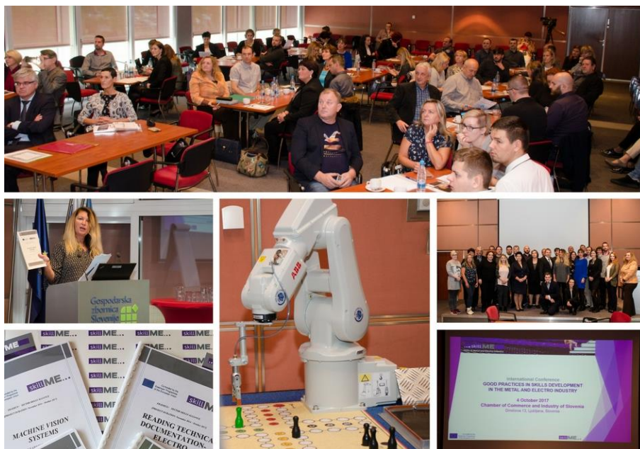
Starptautiskā skillME konference 2017.gada 4.oktobrī Ļubļanā, Slovēnijā.

Konferences mērķis bija prezentēt labas prakses un inovatīvas pieejas prasmju trūkuma novēršanā, pielīdzinot iegūstamās prasmes darba tirgus prasībām, attīstot jaunas prasmes jaunai nodarbinātībai un pielāgojot nacionālās stratēģijas, lai uzlabotu profesionālās izglītības un apmācību kvalitāti un efektivitāti un paaugstinātu darbinieku konkurentspēju. Tika prezentētas dažādas pieejas profesionālās izglītības stiprināšanā un izstrādāto mācību programmu ieviešanas nacionālās stratēģijas skillME projekta dalībvalstīs – Slovēnijā, Slovākijā, Latvijā un Horvātijā. Papildus tam pasniedzēji un audzēkņi pastāstīja par savu pieredzi pilotapmācību ieviešanas laikā un demonstrēja apmācību piemērojamību un rezultātus, balstoties uz Tehniskās redzes apmācību programmu – kameru pielietošana robotu vadībai, ko prezentēja audzēkņi no Stará Turá Tehniskās vidusskolas. Vairāk informācijas par konferenci projekta mājas lapā .